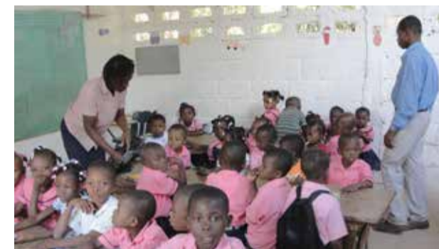
Jeunes écoliers entourés de leurs instituteurs.