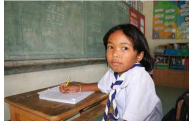
Une écolière de l'école Ban Huasapan.

25 ans d'action au bénéfice de l'enfance défavorisée