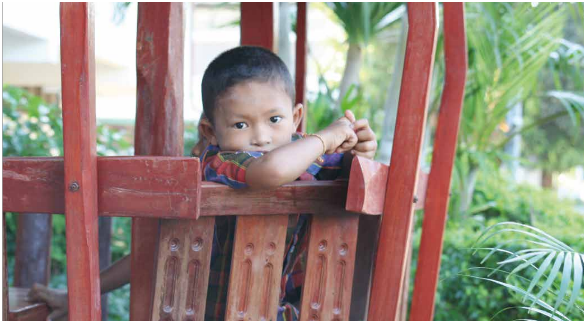
Un jeune écolier de l'école Wat Lalud en Thaïlande.