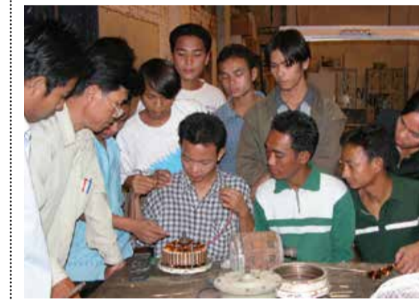
Travaux pratiques des apprentis.

Quand la formation professionnelle mène à la création d'activités