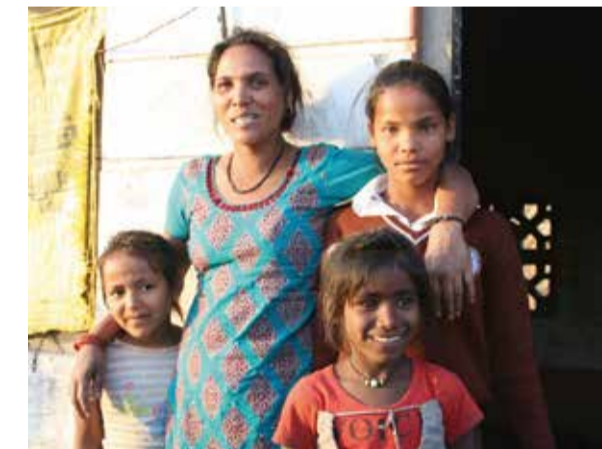
Famille bénéficiaire du programme.

Les maigres ressources familiales proviennent d'activités précaires comme celles de chiffonniers, ouvriers agricoles à la journée ou domestiques.